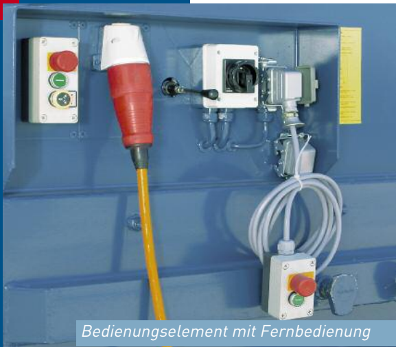
Bedienungselement mit Fernbedienung