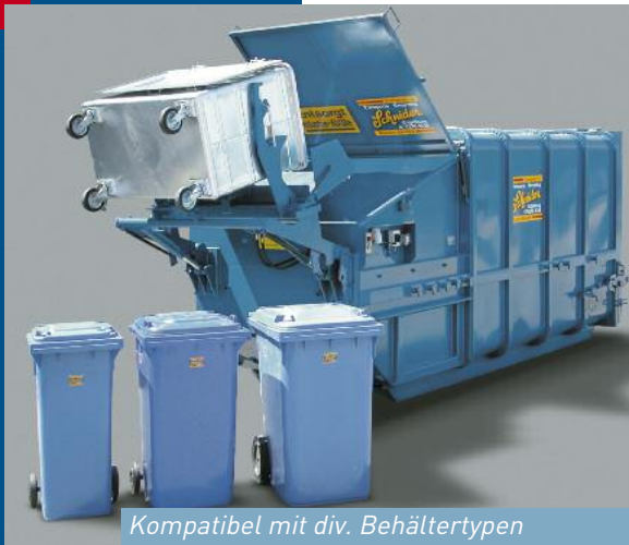
Kompatibel mit div. Behältertypen

Der Presscontainer wird am Aufstellungsort mittels Elektrokabel (siehe technische Angaben) angeschlossen. Durch den entsprechenden Wahlschalter an der Bedienungstafel oder der Fernbedienung wird die Presseinrichtung gestartet. Der Pressvorgang läuft automatisch ab.