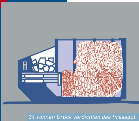
34 Tonnen Druck verdichten das Pressgut

Die Befüllung des Presscontainers kann von Hand oder durch ein integriertes Hub/Kippgerät (für Behälter von 140-1100 Litern) ebenerdig oder ab einer Rampe erfolgen. Jede Abteilung oder jeder Arbeitsplatz kann mit den passenden Behältern ausgerüstet werden. Dadurch entfällt das lästige Umleeren in andere Gefäße. Der Einsatz eines Presscontainers reduziert die Arbeitsvorgänge und verringert den Aufwand.