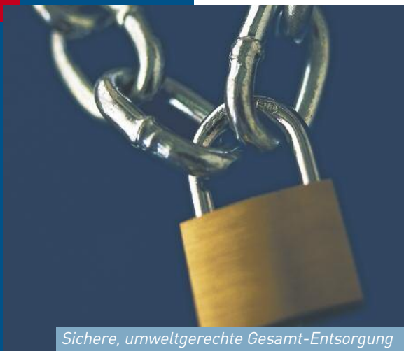
Sichere, umweltgerechte Gesamt-Entsorgung

Wir von der Schnider AG bieten Ihnen den passenden Service. Vertrauen auch Sie uns, wenn es um Entsorgung geht. Unsere Mitarbeiter beraten Sie gerne!