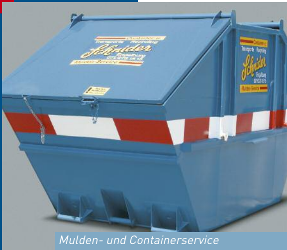
Mulden- und Containerservice