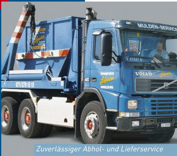
Zuverlässiger Abhol- und Lieferservice