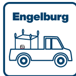
Anlieferung durch Kunde