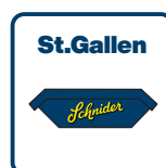
Abholung durch Schnider AG