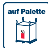
Abholung durch Schnider AG