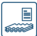
asbestfrei lose nur mit Deklaration

Nr. 90019 / Eternit, festgebundener asbestfreier Faserzement (17 01 07)